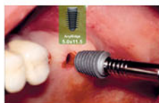
Установка имплантата диаметром 5,0 мм