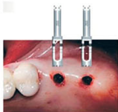
Минимальная травма - формирование ложа трепаном 3,5 мм