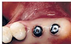
Хорошая первичная стабилизация позволяет сразу фиксировать формирователи десны